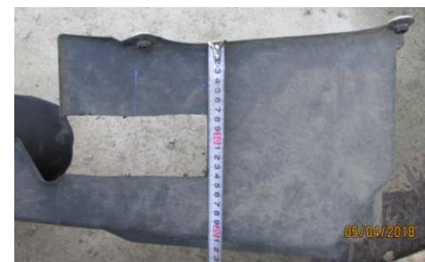
Рис.2 Вырез в левом пыльнике.

4.8. Сделать вырез в левом пыльнике 68х155 мм (см. рис.2).